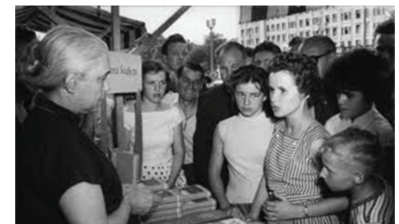
Anna Seghers mit Leserinnen und Lesern, 1957